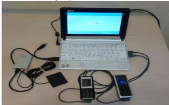
Рисунок 1 - Общий вид ВЕКТОР-СИДС-2012

Этикетка с наименованием СИ, знаком утверждения типа, заводским №, датой выпуска и местом пломбирования представлены на рисунке 3.