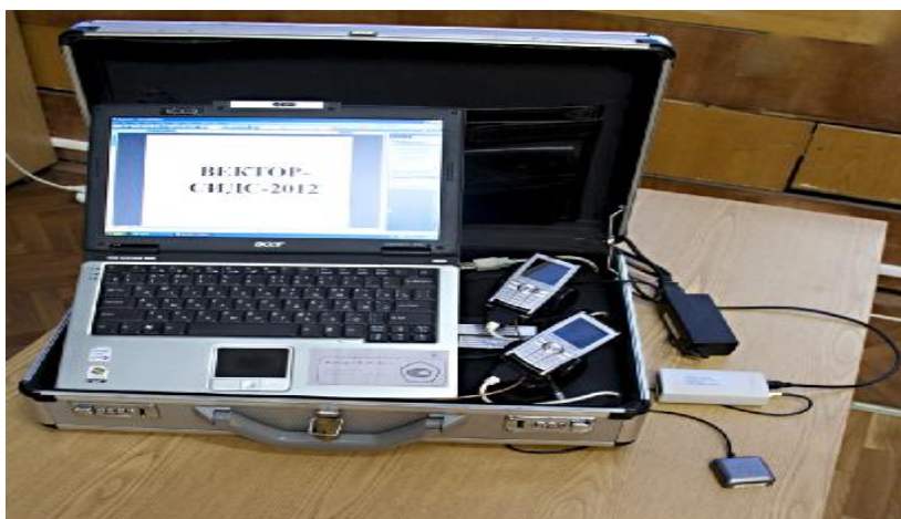
Рисунок 2 - Общий вид ВЕКТОР-СИДС-2012 в сумке-кейсе