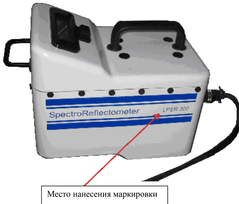
Рисунок 2 – Измерительная ячейка спектрорефлектометров лабораторных портативных LPSR-300 и место нанесения маркировки (вид сбоку)