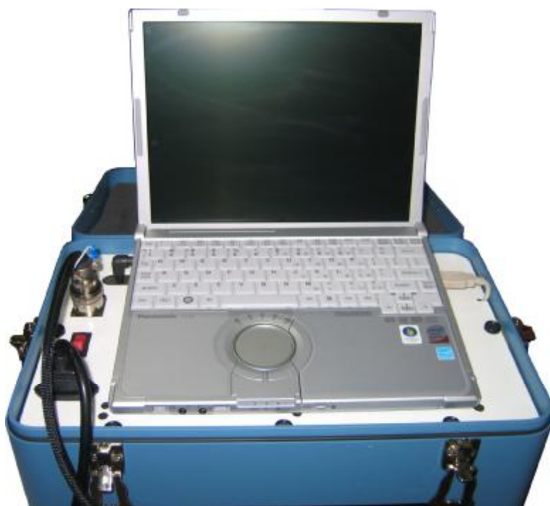
Рисунок 4 – Общий вид модуля блока питания спектрорефлектометров лабораторных портативных LPSR-300 с персональным компьютером