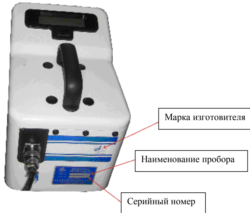
Рисунок 1 - Общий вид измерительной ячейки спектрорефлектометров лабораторных портативных LPSR-300 и места нанесения маркировки