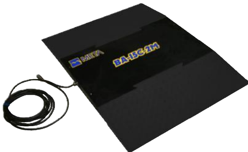
Рисунок 2 - Внешний вид весов ВА-15С-2М

Конструктивно весы ВА-15С-3, ВА-15С-3М (рис.3) состоят из двух грузоприемных платформ, устанавливаемых на каркас фундамента (приямка), встроенного в дорожное полотно.