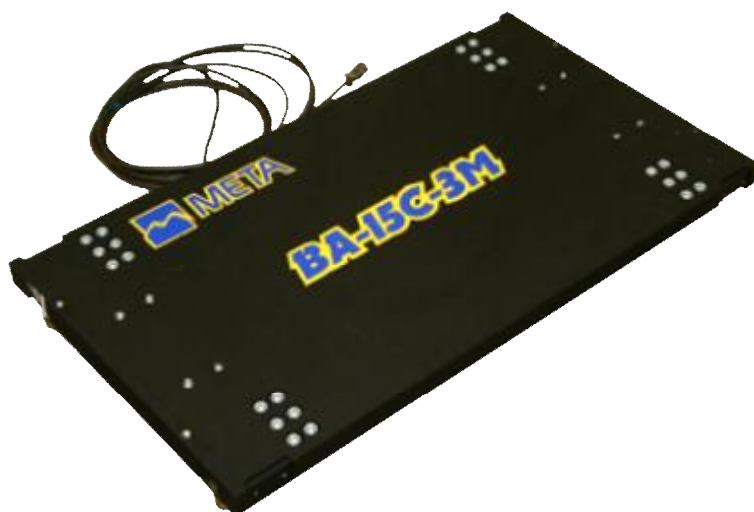
Рисунок 3 - Внешний вид весов ВА-15С-3М и ВА-15С-3

Платформы комплектуются съемными ручками для удобства монтажа, которые закрепляются на весах с помощью быстросъемных болтов.