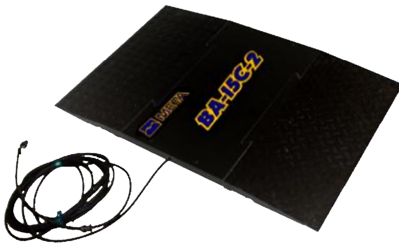
Рисунок 1 - Внешний вид весов ВА-15С-2

Для переноски весов предусмотрены две съемные рукоятки (одна из которых имеет колеса для перевозки), которые крепятся к платформе поочередно с помощью быстросъемных болтов.