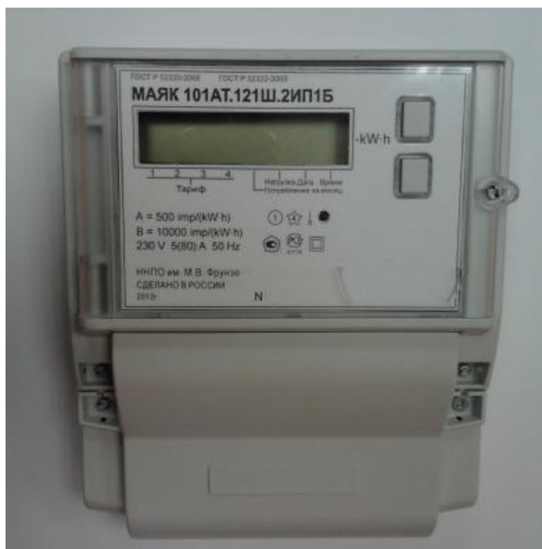
Рисунок 1 – Внешний вид счетчика с закрытой клеммной крышкой

Внешний вид счетчика МАЯК 101АТ с закрытой клеммной крышкой приведен на рисунке 1.