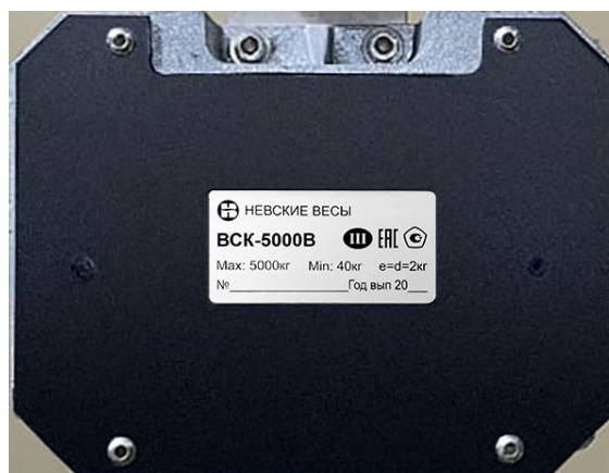
Рисунок 2 – Пример маркировки весов