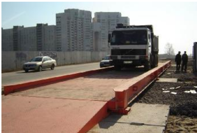
Рис. 1. Общий вид весов «АТЛАНТ-М»