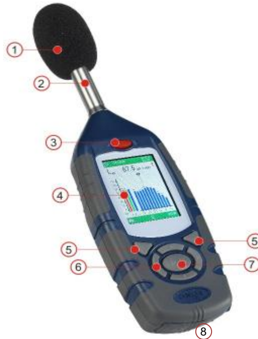
1 – Противоветровая защита, 2 – Встроенный предусилитель, 3 – Кнопка ВКЛ./ВЫКЛ., 4 – Дисплей, 5 – Программные кнопки, 6 – Кнопки курсора навигации, 7 – Кнопка Запуск/Остановка (Run/Stop), 8 – Разъемы для подключения внешних устройств