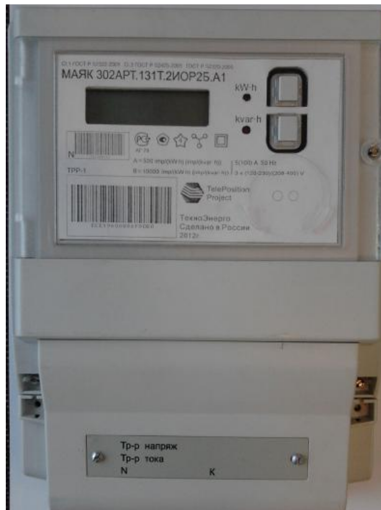
Рисунок 1 – Внешний вид счетчика с закрытой клеммной крышкой

Внешний вид счетчика МАЯК 302АРТ с закрытой клеммной крышкой приведён на рисунке 1.