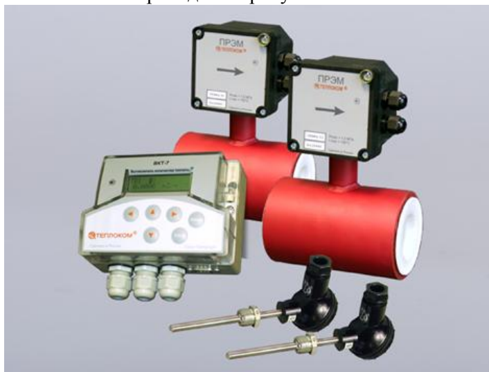
Рисунок 1 – Внешний вид теплосчетчика

Внешний вид теплосчетчика приведен на рисунке 1.