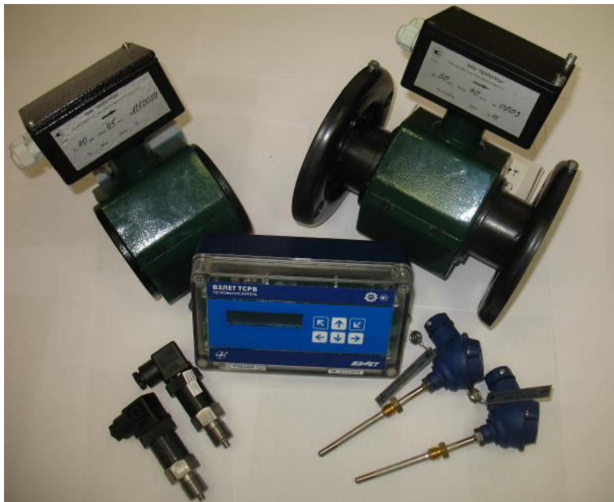
Рисунок 1 – Внешний вид теплосчетчика

Внешний вид теплосчетчика приведен на рисунке 1.