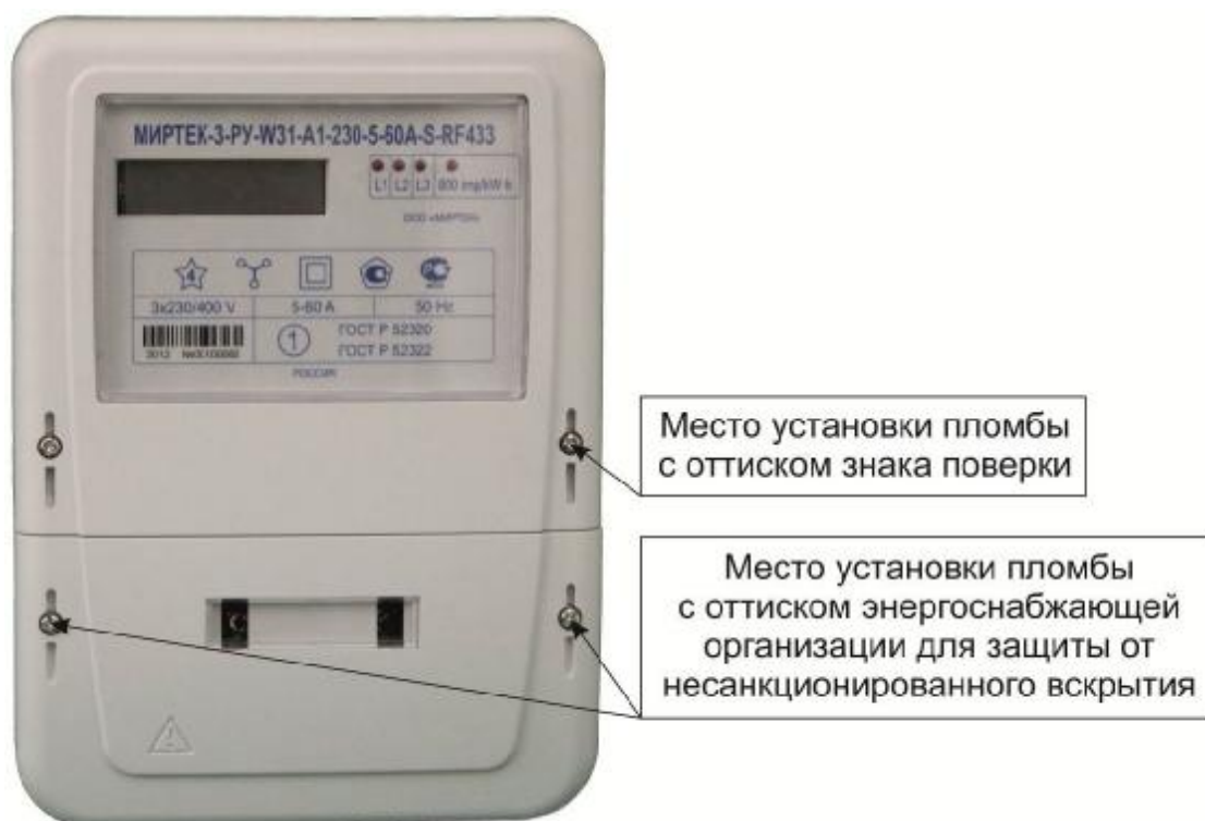
Рисунок 2 – Общий вид счетчика в корпусе модификации W31

Фотографии общего вида счётчиков, с указанием схем пломбировки от несанкционированного доступа, приведены на рисунках 2 – 4.