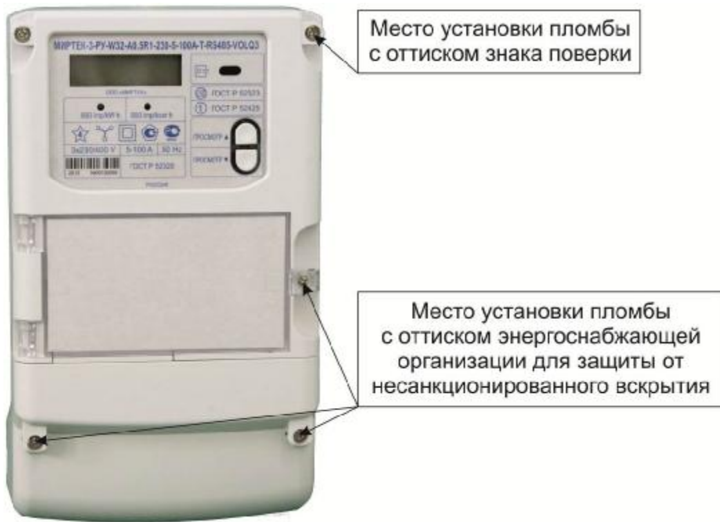
Рисунок 3 – Общий вид счетчика в корпусе модификации W32