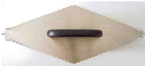
а) Мера диаметром от 50 до 230 мм и длиной 390 мм

Мера длиной 165 мм и диаметром от 8 до 140 мм (Рисунок 1d) представляет собой 33 шлифованных цилиндра разных диаметров, уменьшающихся от центра меры к его торцам. Мера также имеет отверстия для крепления ее в центрах.