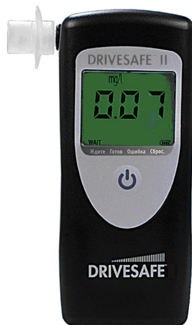
Рисунок 2 – Общий вид анализатора (два варианта оформления лицевой панели).