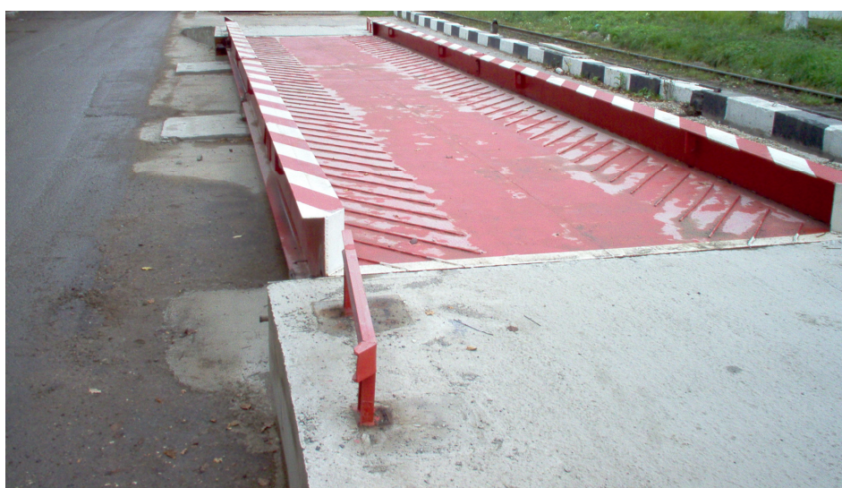
Рисунок 1 – Общий вид весов автомобильных BC-A

Общий вид весов автомобильных BC-A представлен на рисунке 1.