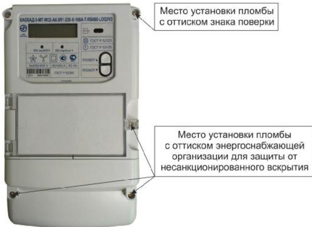
Рисунок 3 – Общий вид счетчика в корпусе модификации W32