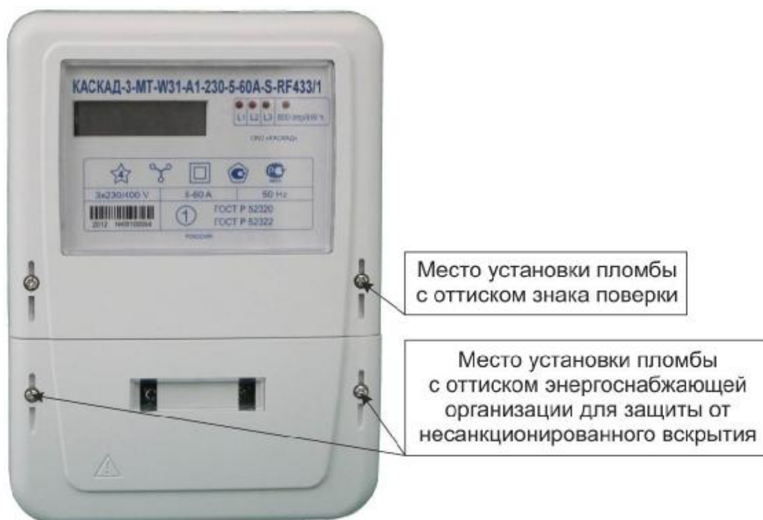
Рисунок 2 – Общий вид счетчика в корпусе модификации W31

Фотографии общего вида счетчиков, с указанием схем пломбировки от несанкционированного доступа, приведены на рисунках 2 – 4.