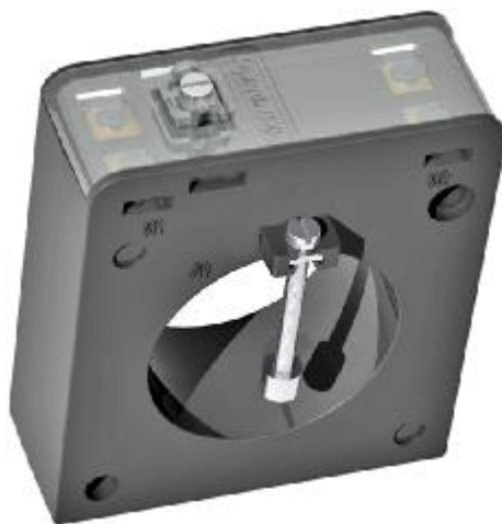
Рисунок 1 – Внешний вид трансформаторов

Схема пломбировки от несанкционированного доступа и обозначение места нанесения знака поверки приведены на рисунке 2.