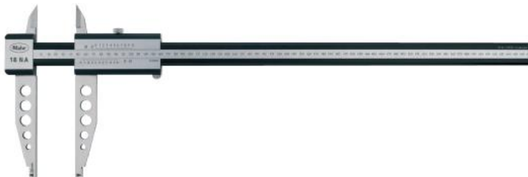
Рисунок 7 – Общий вид штангенциркулей с отсчетом по нониусу MarCal 18 NA