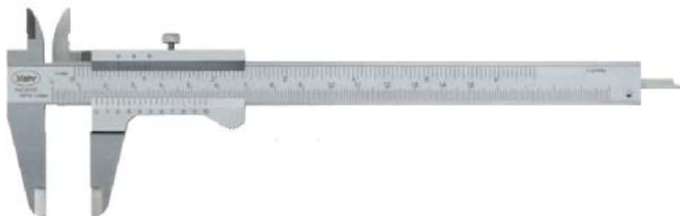
Рисунок 2 – Общий вид штангенциркулей с отсчетом по нониусу MarCal 16 FN