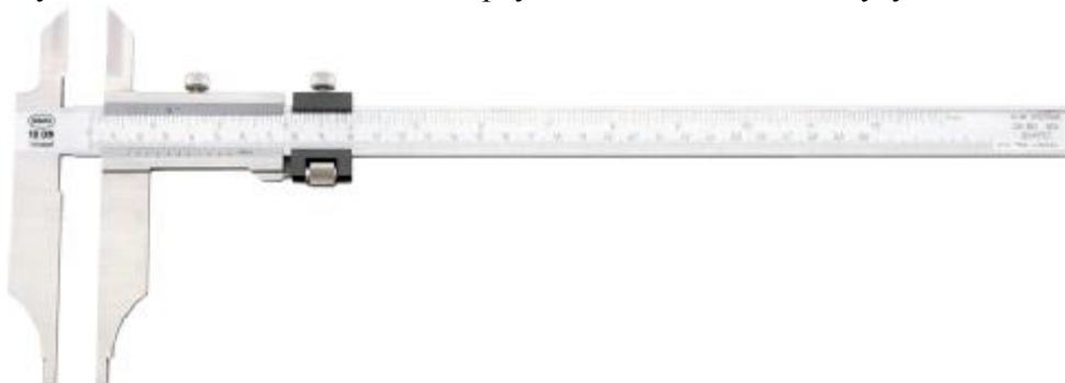
Рисунок 6 – Общий вид штангенциркулей с отсчетом по нониусу MarCal 18 DN