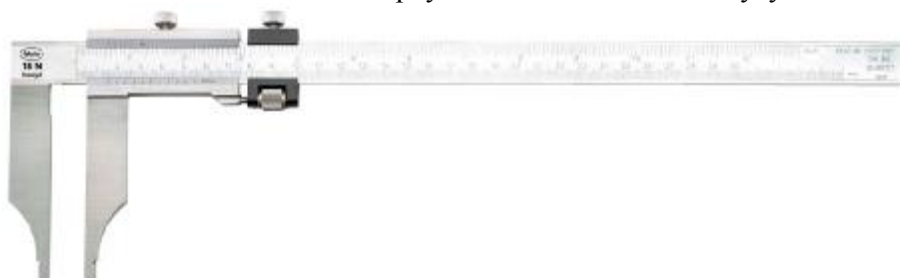
Рисунок 5 – Общий вид штангенциркулей с отсчетом по нониусу MarCal 18 N