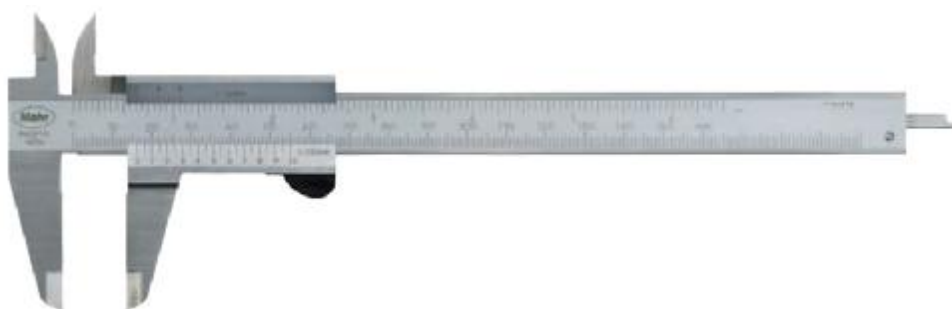
Рисунок 4 – Общий вид штангенциркулей с отсчетом по нониусу MarCal 16 DN