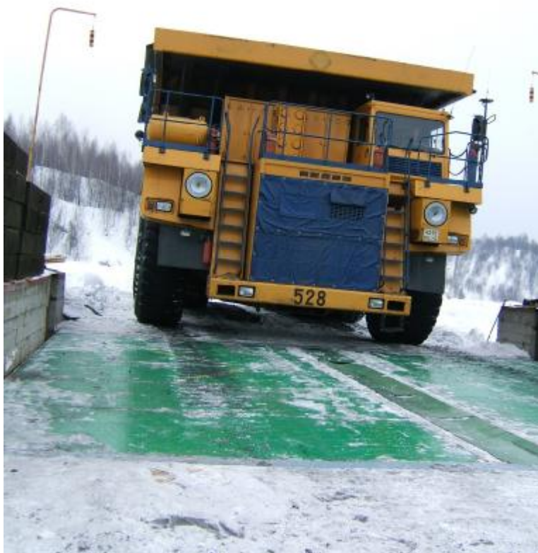
Рис. 1. Общий вид весов ТИТАН-М