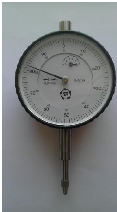
Рисунок 1 – Общий вид индикаторов часового типа с ценой деления 0,01 мм.