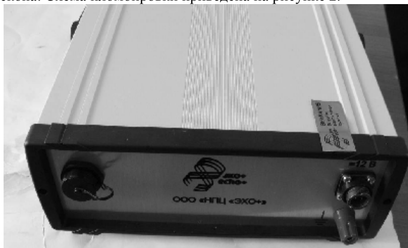
Рисунок 2 – Схема пломбировки блока системного дефектоскопа от несанкционированного доступа

Для предотвращения несанкционированного доступа используется пломбировка блока системного дефектоскопа. Схема пломбировки приведена на рисунке 2.