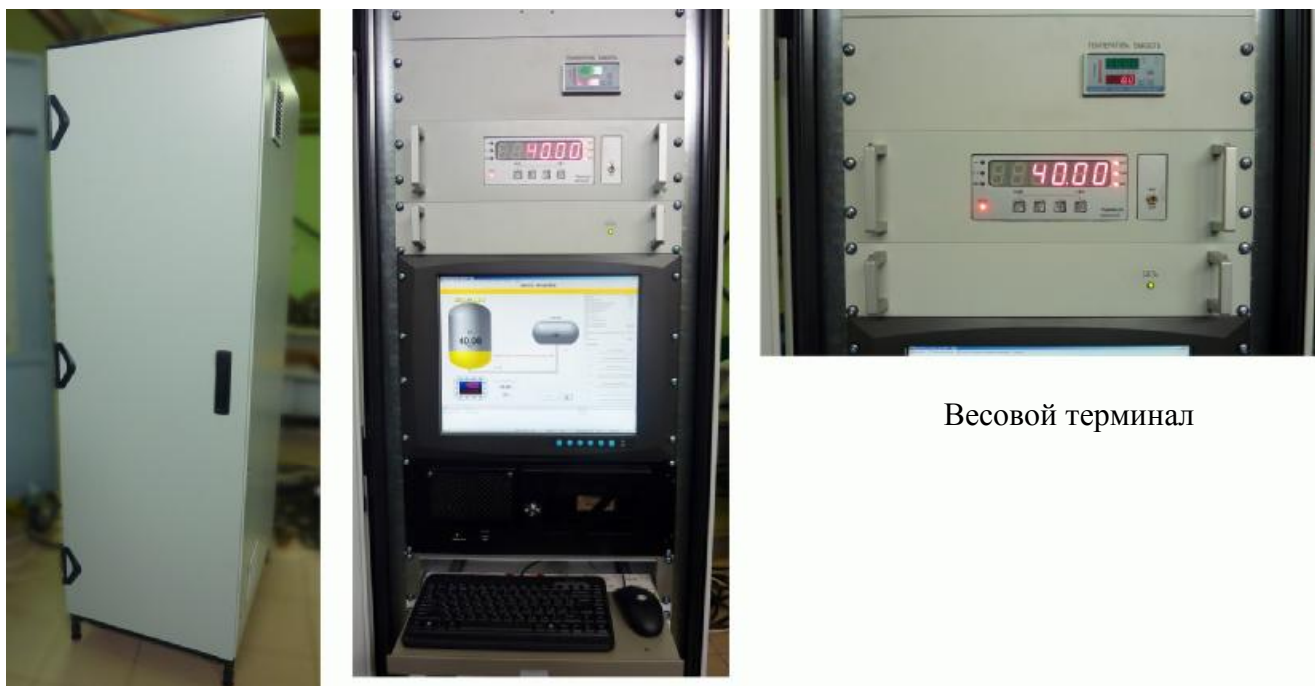
Рабочее место оператора