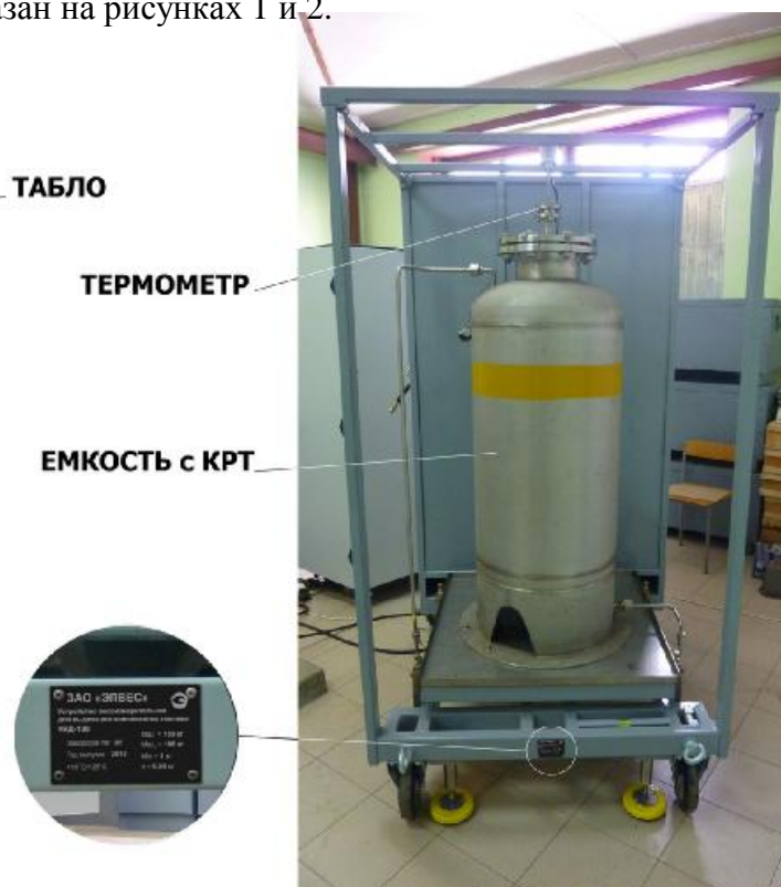
Рисунок 2 - Внешний вид УВД (вид сзади)