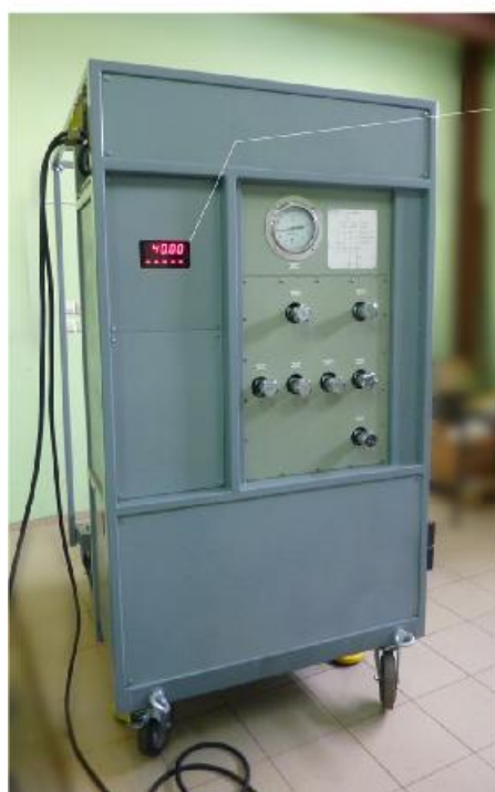
Рисунок 1 - Внешний вид УВД (вид спереди)

Внешний вид устройства показан на рисунках 1 и 2.