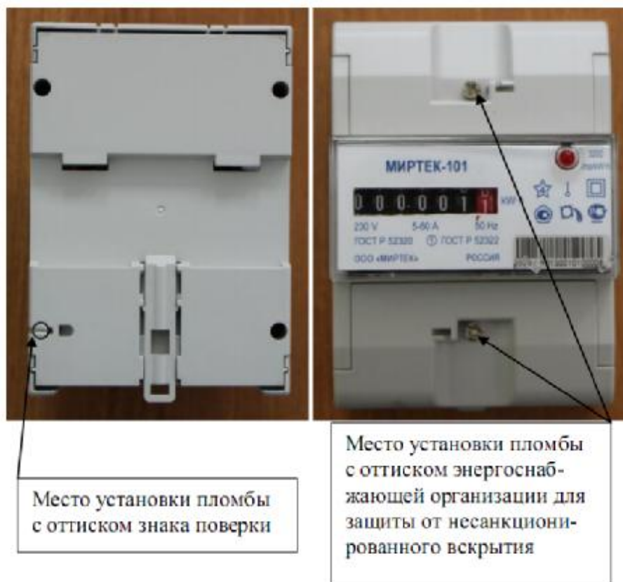
Рисунок 4 – Общий вид счетчика в корпусе модификации D1