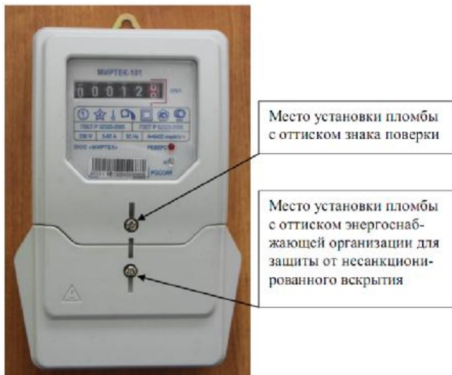
Рисунок 2 – Общий вид счетчика в корпусе модификации W1

Фотографии общего вида счетчиков, с указанием схем пломбировки от несанкционированного доступа, приведены на рисунках 2 – 8.