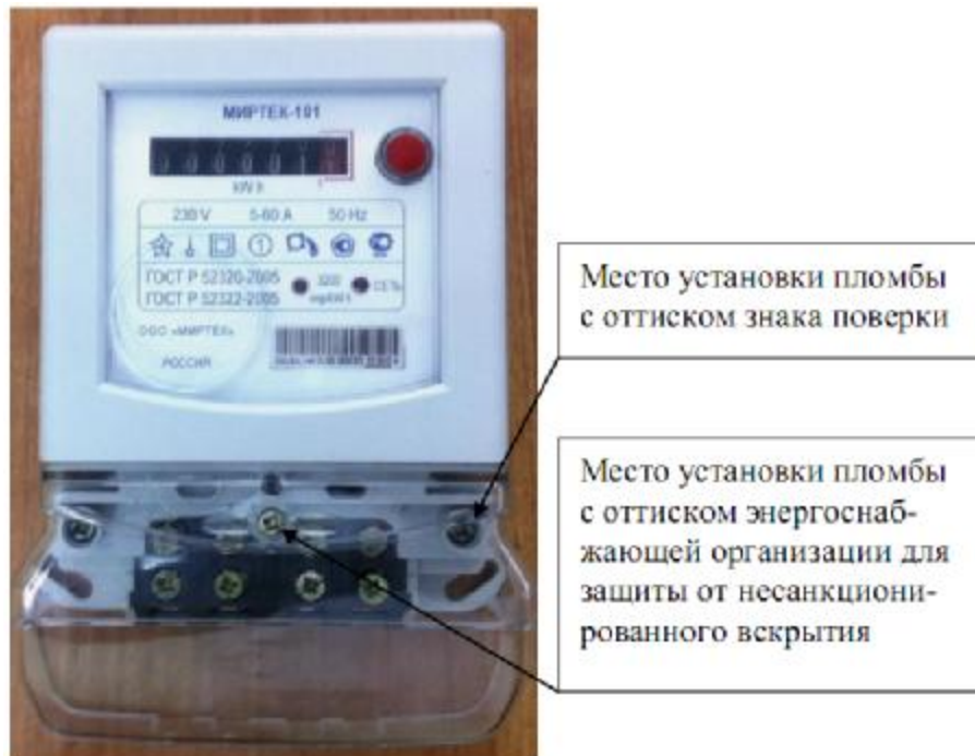
Рисунок 3 – Общий вид счетчика в корпусе модификации W2