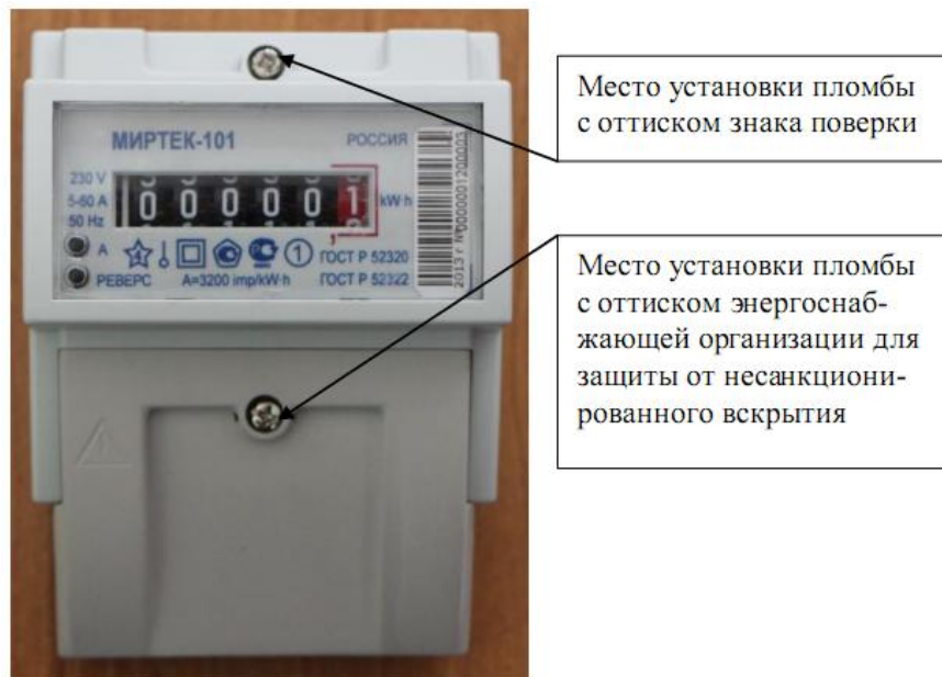
Рисунок 7 – Общий вид счетчика в корпусе модификации D5