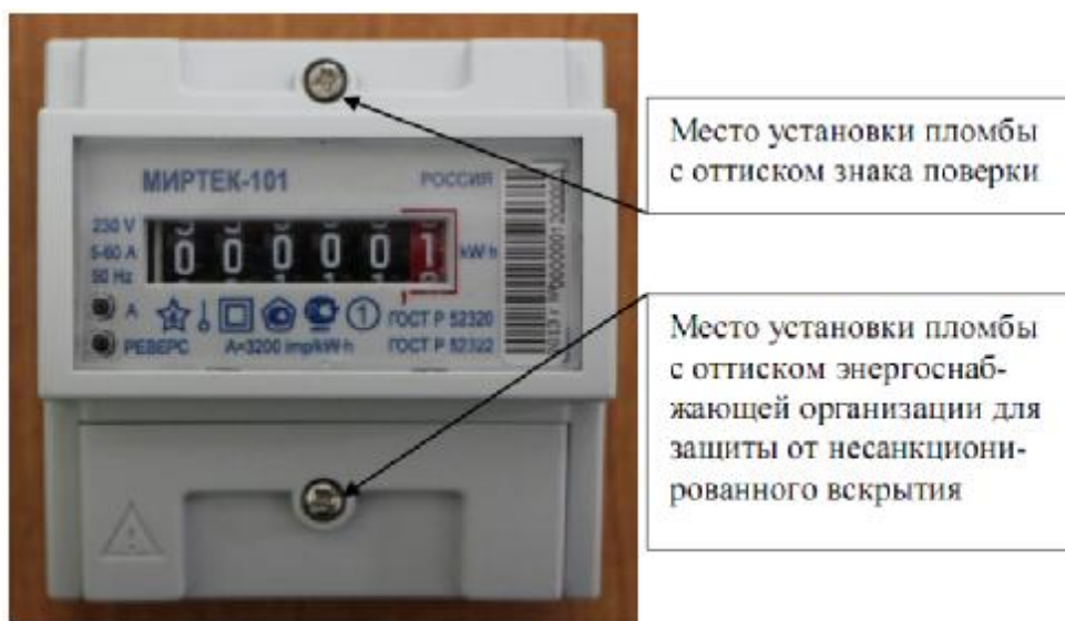
Рисунок 5 – Общий вид счетчика в корпусе модификации D3