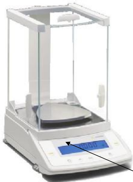
Рис. 2в – Весы СРА1003S- 0СЕ