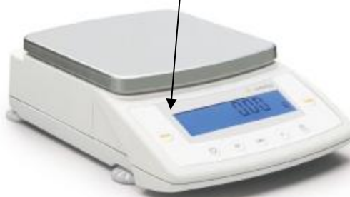
Рис. 3д – Весы СРА6202S-0СЕ, СРА4202S-0СЕ, СРА3202S-0СЕ, СРА2202S-0СЕ, СРА6202P-0СЕ, СРА10001-0СЕ, СРА8201-0СЕ, СРА5201-0СЕ, СРА2201-0СЕ

Места нанесения поверительного клейма (знака поверки в виде наклейки) обозначены стрелками.