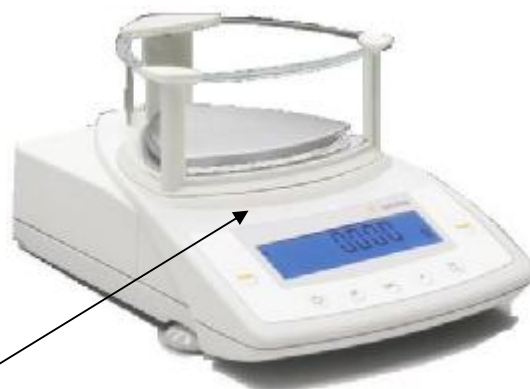
Рис. 2г – СРА623S-0СЕ, СРА423S-0СЕ, СРА323S-0СЕ, СРА223S-0СЕ