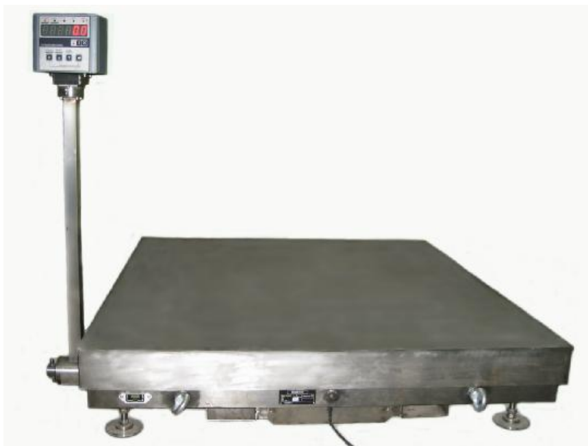
Рисунок 1 - Внешний вид устройства весоизмерительного мобильного МВУ

Схема пломбировки устройств представлена на рисунке 2.