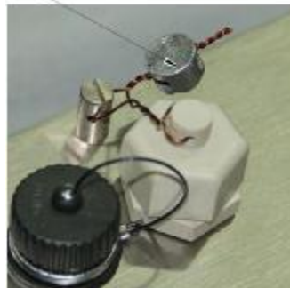
Весы с прибором МИ ВЖА/А12ЯС