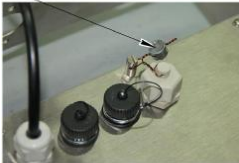
Весы с прибором МИ ВДА/12ЯС