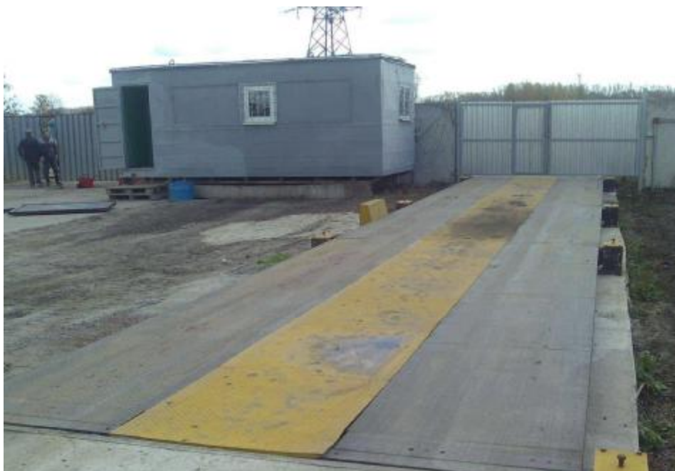
Рисунок 1- Общий вид ГПУ весов.

Принцип действия весов основан на преобразовании деформации упругого элемента датчика, возникающей под действием взвешиваемого груза в аналоговый электрический сигнал, пропорциональный его массе. Далее этот сигнал преобразуется в цифровой код и обрабатывается. Измеренное значение массы выводится на дисплей электронного весоизмерительного прибора.