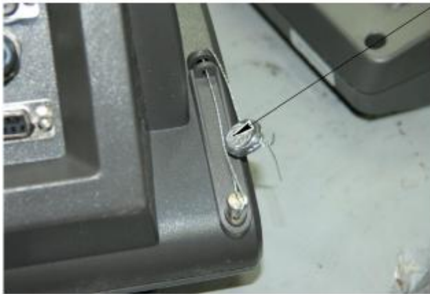
Весы с прибором МИ ВДА/12Я