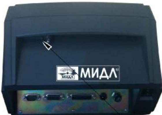
Пломба с оттиском с поверительного клейма