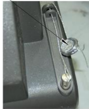
Весы с прибором МИ ВЖА/12Я