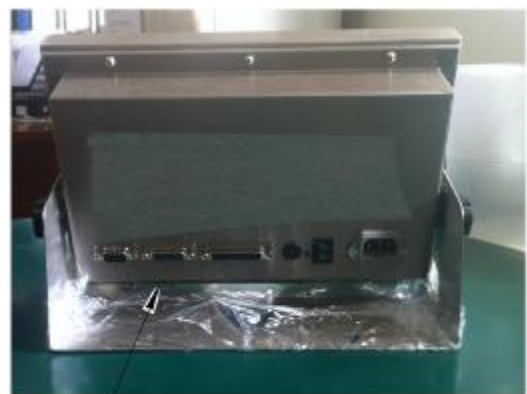
Пломба с оттиском поверительного клейма