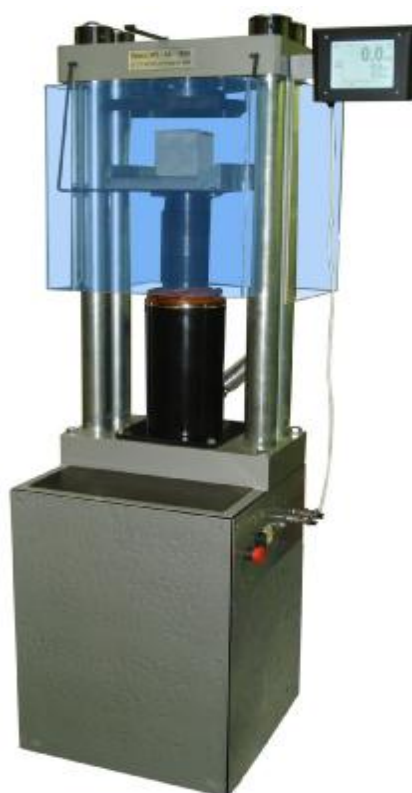
Рисунок 2. Общий вид