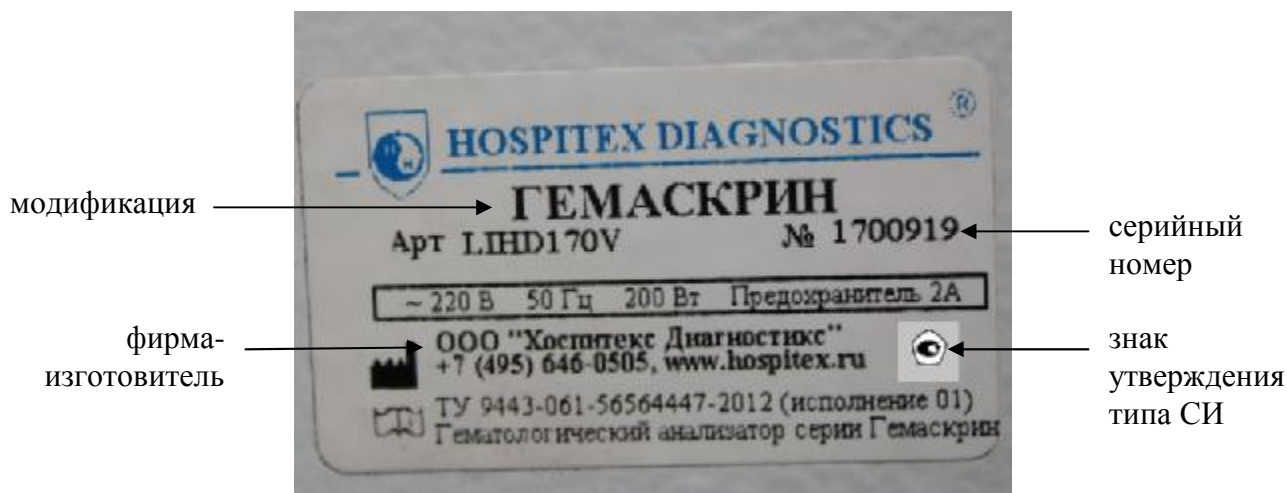
Рисунок 4 – Схема маркировки анализаторов

В анализаторах используется встроенное программное обеспечение, которое устанавливается заводом-изготовителем непосредственно в ПЗУ анализаторов.