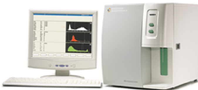
Рисунок 2 – Общий вид Анализаторов гематологических серии Гемаскрин исполнения 05-08