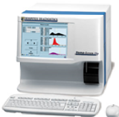
Рисунок 1 – Общий вид Анализаторов гематологических серии Гемаскрин исполнения 01-04

Общий вид маркировки и пломбировки анализаторов представлен на рисунке 3, схема маркировки – рисунок 4.