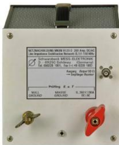
Рис. 1а Внешний вид эквивалентов сети NNBL 8225, NNBL 8226, NNBM 8126A 890, NNBM 8126D

Места пломбировки от несанкционированного доступа и обозначение мест для размещения наклейки приведены на рисунке 2.