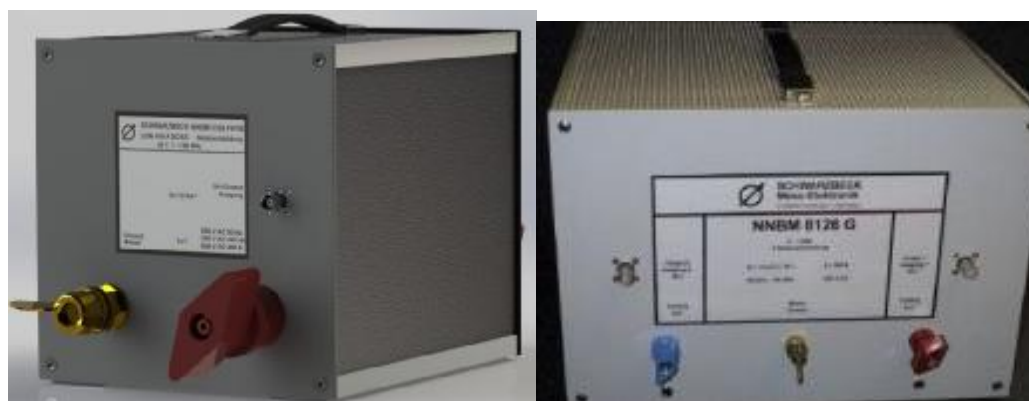
Рис. 1г Внешний вид эквивалентов сети NNBM 8126F HYB (слева) NNBM 8126G (справа)