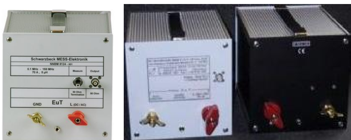
Рис. 1в Внешний вид эквивалентов сети NNBM 8124 (слева) NNBM 8126А (справа)