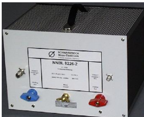
Рис. 1б Внешний вид эквивалентов сети NNBL 8226-2, NNBL 8226-HV