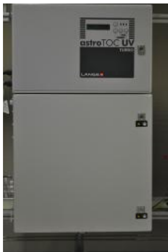
Рис. 1. Анализатор ASTRO TOC UV Вид спереди.