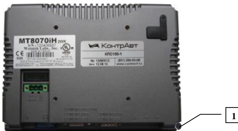
Рисунок 2 – Защита панели оператора прибора от несанкционированного вскрытия с помощью поверительного клейма

Для защиты от несанкционированного доступа, после проверки прибора, на корпус панели оператора наносится поверительное клеймо путем давления на специальную мастичку. Внешний вид задней панели оператора с поверительным клеймом приведен на рисунке 2 (поз. 1).