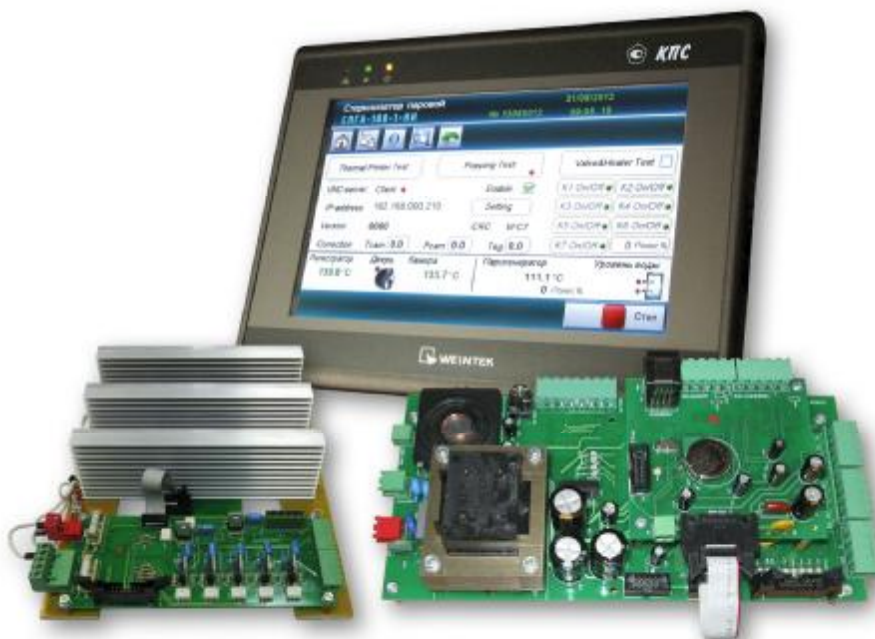
Рисунок 1- Общий вид прибора: блок управления с блоком регистрации, панель оператора и блок силовых ключей

Внешний вид прибора показан на рисунке 1.