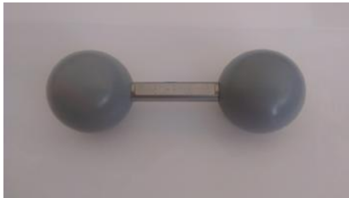
Рисунок 1 - Общий вид мер с шарообразными элементами