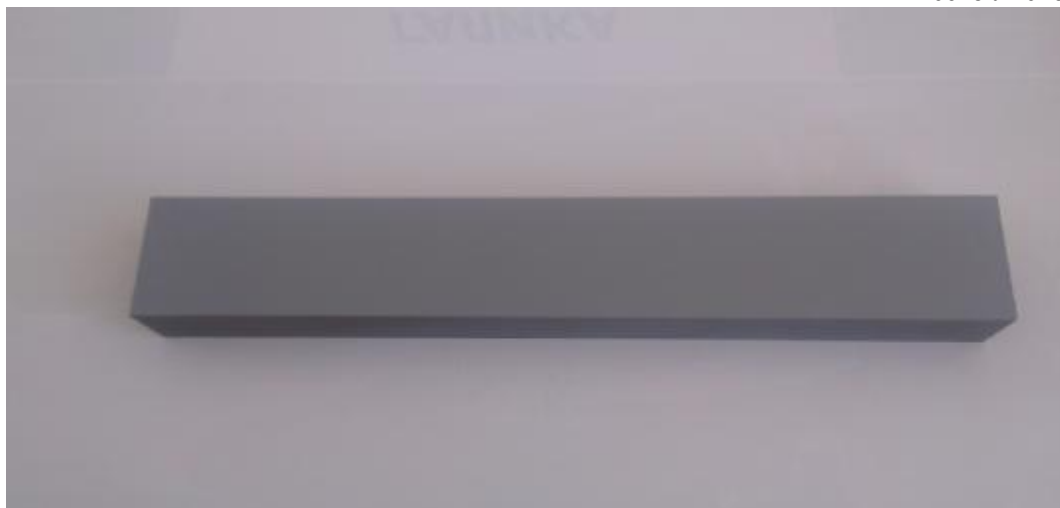
Рисунок 3- Общий вид меры отклонений от плоскостности

Меры с шарообразными элементами выпускаются 10 типоразмеров, отличающихся габаритными размерами, расстоянием между сферами и диаметром сфер. Меры с шарообразными элементами имеют вид гантели со стальными либо керамическими сферами с антибликовым покрытием с известными диаметрами D_p и расстояниями между центрами сфер L_p . Для разных измерительных объемов сканеров используются меры с разными диаметрами сфер и межцентровых расстояний. Принцип действия мер с шарообразными элементами основан на измерении расстояния между центрами сфер и последующем определении отклонений измеренных величин от действительных значений.