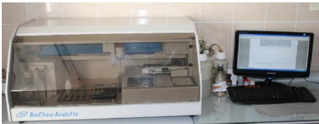
Рисунок 1 – Общий вид Анализатора автоматического биохимического и иммуноферментного BioChem Analette

Схема маркировки и пломбировки анализатора представлена на рисунке 2.