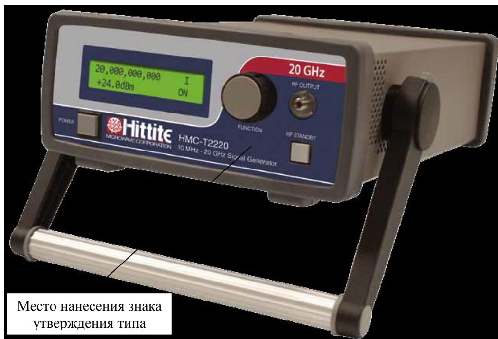
Рисунок 3 – Внешний вид генераторов HMC-T2220