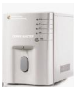
Рисунок 2 – Общий вид Анализаторов исполнения 02