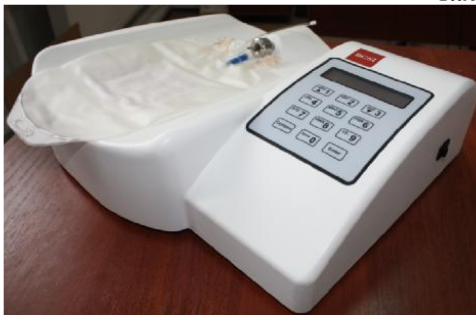
Рисунок 1 – Общий вид системы