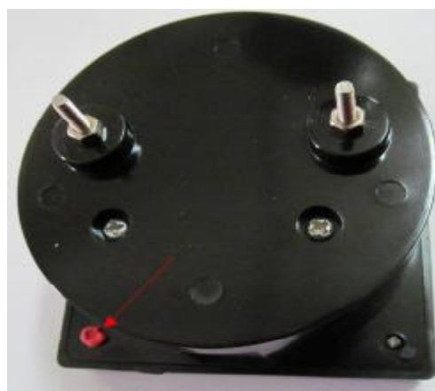
Рис. 4 Место пломбирования