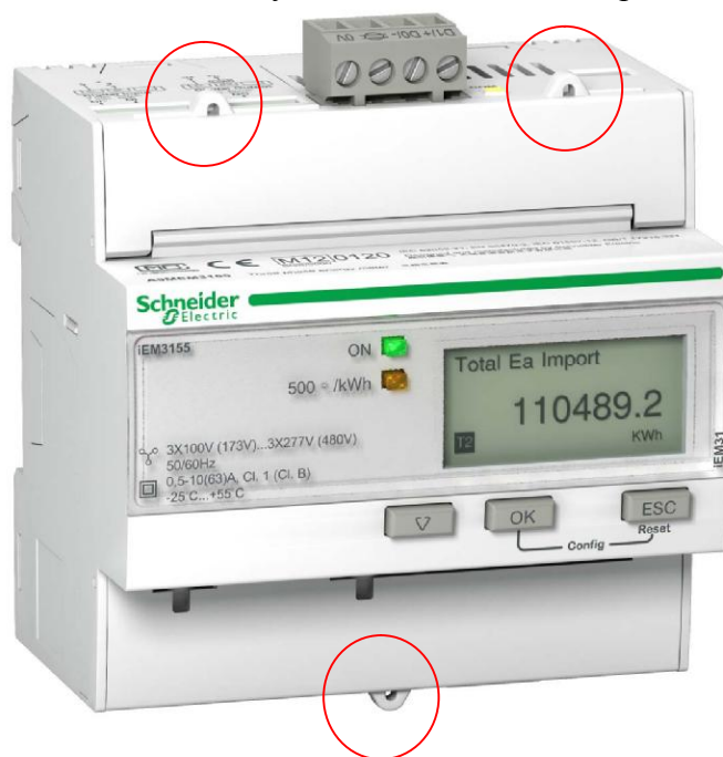
Рисунок 3 - Фотография счетчика серии iEM3000 (модель iEM3155)

Красным кругом выделено место установки клейма поверителя в виде наклейки.