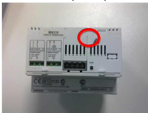
Рисунок 2 - Фотография счетчика серии iEM3000 (модель iEM3155)

Фотография счетчика и места опломбирования представлены на рисунках 2 и 3.