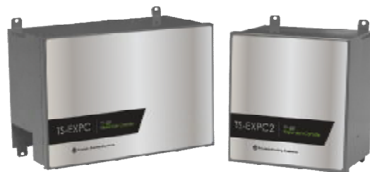
Рисунок 6 – Блоки расширения TS-EXPC и TS-EXPC2 для консоли TS-550 evo