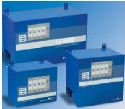
Рисунок 2 – Консоли TS-5, TS-550, TS-5000

Консоли имеют последовательный интерфейс передачи данных RS-232C, а также могут быть дополнительно оснащены аналоговыми входами 4-20 мА (для подключения датчиков утечек), интерфейсами RS-422/485, USB, Ethernet, которые позволяют подключать различные периферийные устройства, такие как принтер, релейные блоки, ПК (персональный компьютер), и интерфейс CAN для подключения блоков расширения.