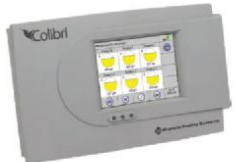
Рисунок 4 – Консоль CL6 (Colibri)