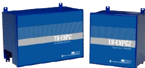
Рисунок 5 – Блоки расширения TS-EXPC и TS-EXPC2 для консолей TS-5, TS-550, TS-5000