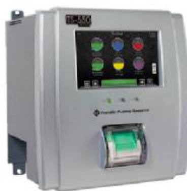
Рисунок 3 – Консоль TS-550 evo