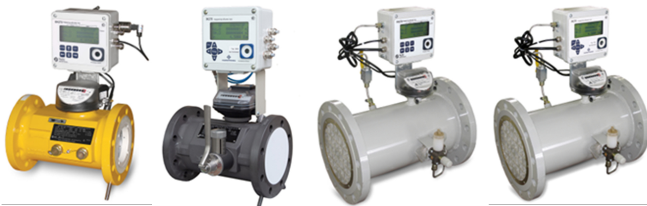
Рисунок 2 – Общий вид комплексов модификации СГ-ЭК-Т