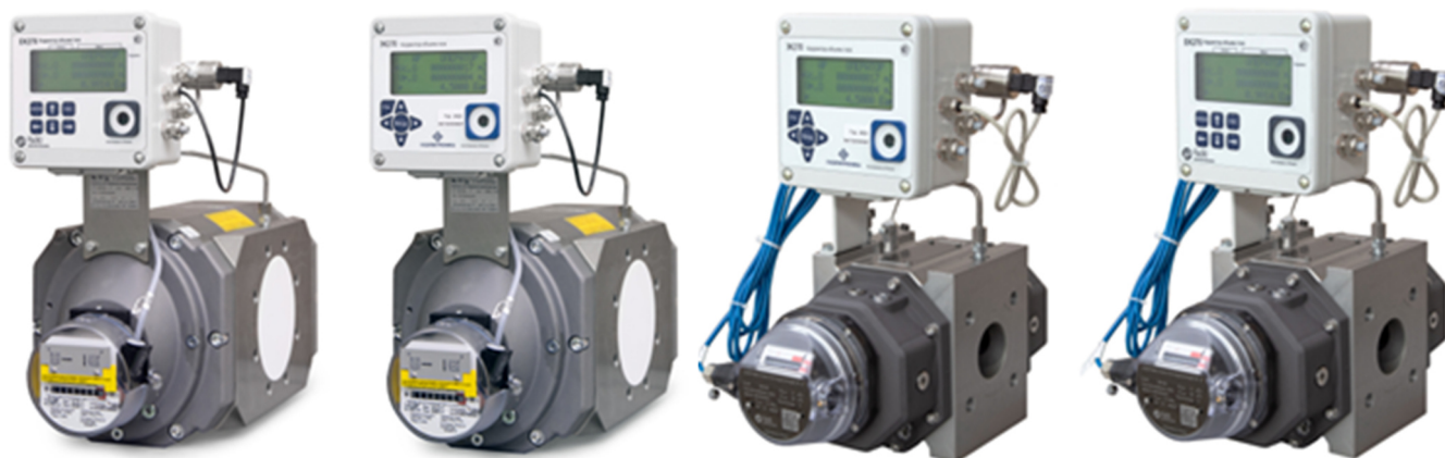
Рисунок 1 – Общий вид комплексов модификации СГ-ЭК-Р

Заводской номер в виде арабских цифр наносится методом термопечати, металлографии и/или гравировки на шильдик, расположенный на крепежной пластине корректора. Места нанесения заводского номера и знака утверждения типа представлены на рисунке 4.