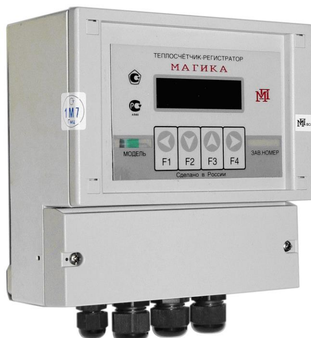
Рисунок 5 - Место пломбирования теплосчетчиков и регистраторов расхода, собранных в корпусе с защитой IP65

Место пломбирования теплосчетчиков и регистраторов расхода собранных в корпусе с защитой IP65, приведено на рис.5.