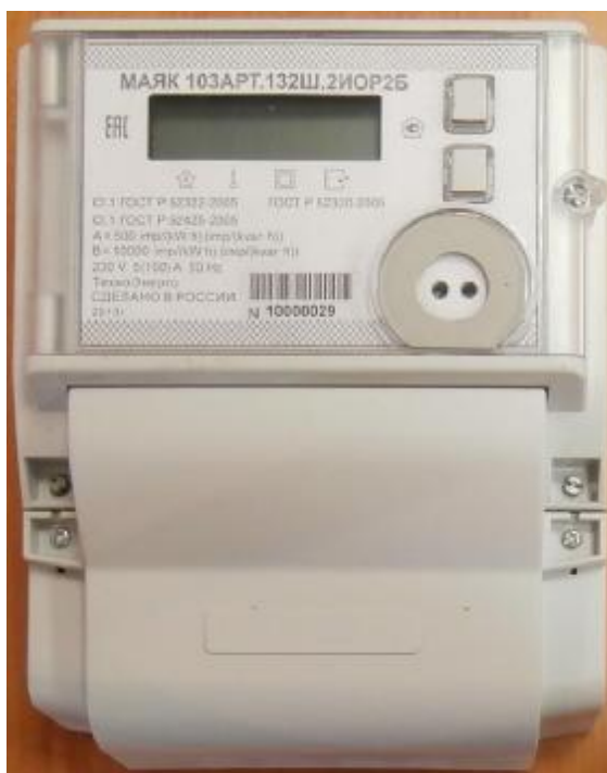
Рисунок 1 – Внешний вид счетчика

Внешний вид счетчика МАЯК 103АРТ приведен на рисунке 1.