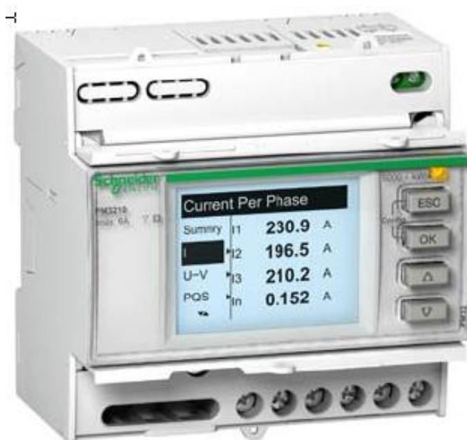
Рисунок 3 - Фотография измерителя мощности серии PM3200 (модель PM3210)