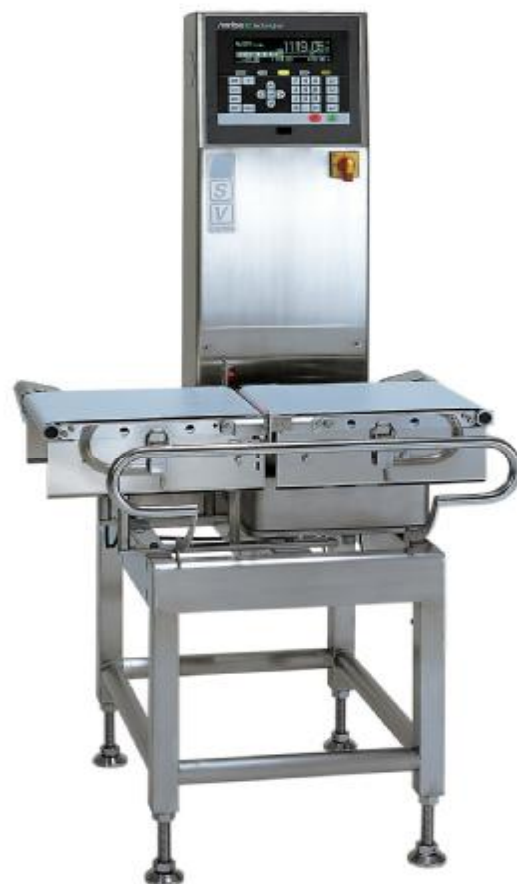
Рисунок 1 - Общий вид модификации KW5