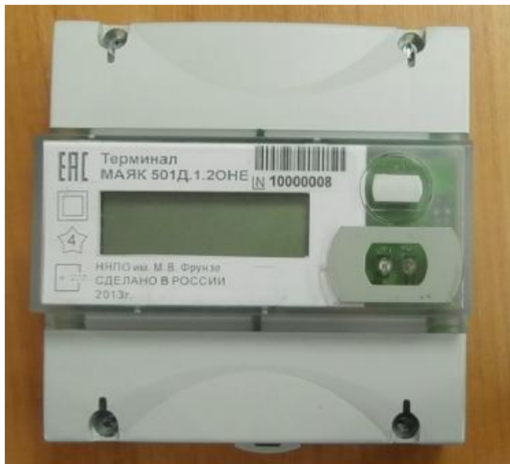
Рисунок 2 – Внешний вид терминала счетчика