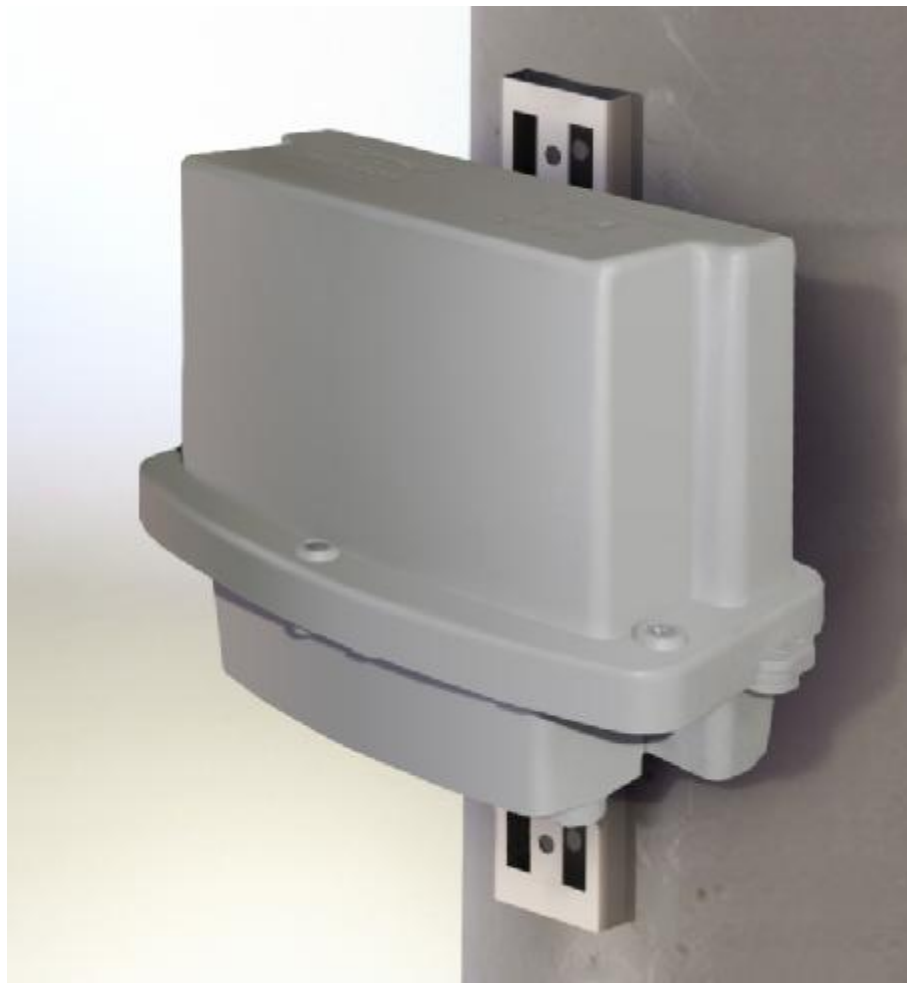
Рисунок 1 – Внешний вид счетчика

Внешний вид счетчика МАЯК 302АРТН приведен на рисунках 1 и 2.