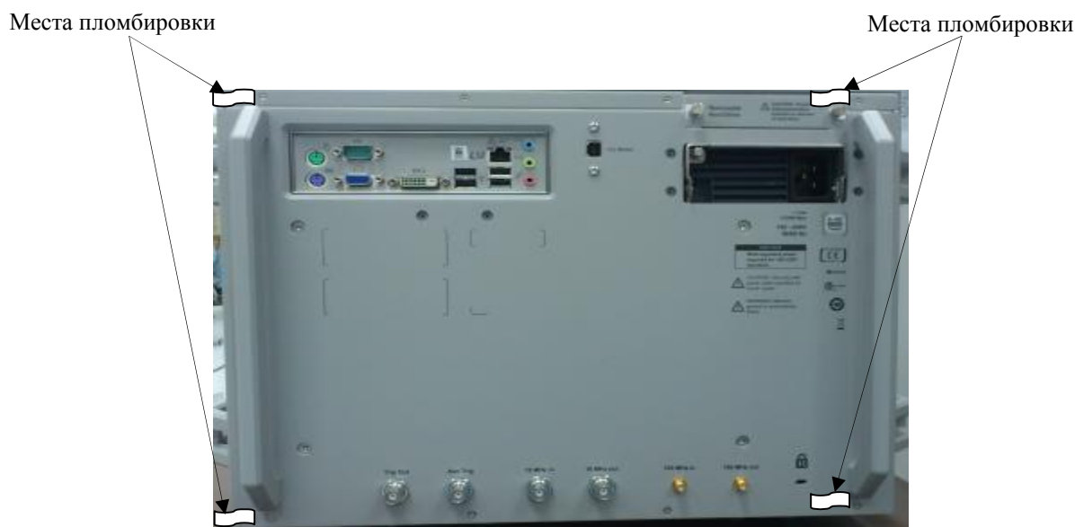
Рисунок 2 - Схема пломбировки от несанкционированного доступа

Опции осциллографов приведены в таблице 1.