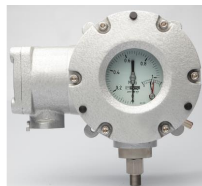
Рисунок 1 – Внешний вид приборов