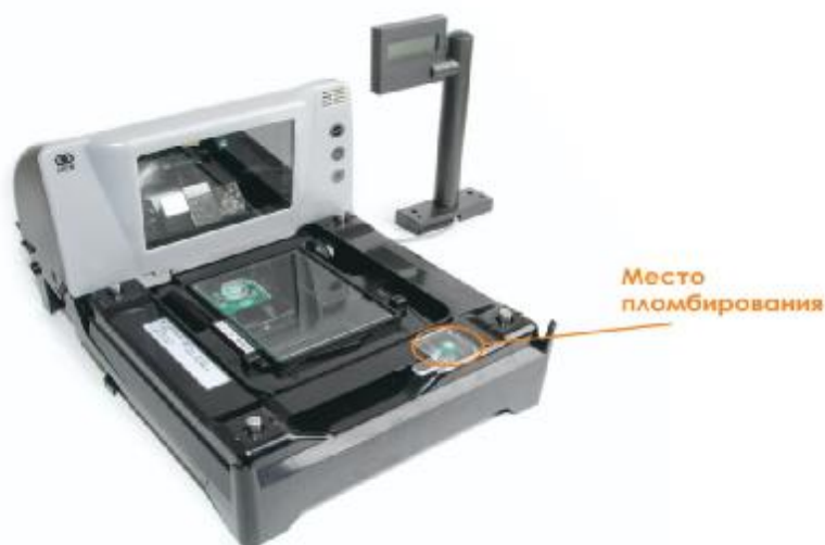
Рисунок 2. Схема пломбирования весов NCR.

Пломба поверителя устанавливается в передней части весов (см. Рисунок 2).