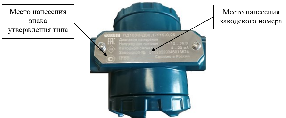
Рисунок 7 – Место нанесения знака утверждения типа, место нанесения заводского номера преобразователей давления измерительных ОВЕН ПД100И со встроенным дисплеем в общепромышленном исполнении и в исполнении со взрывонепроницаемой оболочкой

Пломбирование преобразователей не предусмотрено.