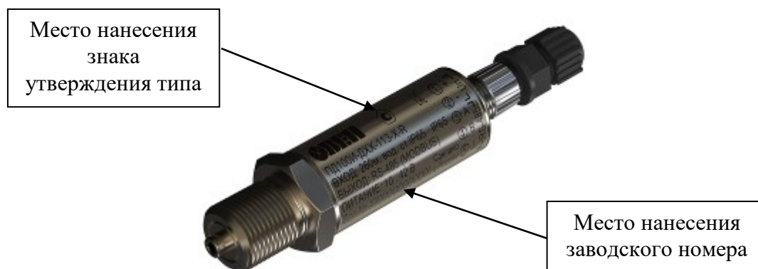
Рисунок 3 – Общий вид преобразователей давления измерительных ОВЕН ПД100И с разъёмом М12 с типами измеряемого давления ДА, ДИ, ДВ, ДИВ с указанием места нанесения знака утверждения типа, места нанесения заводского номера