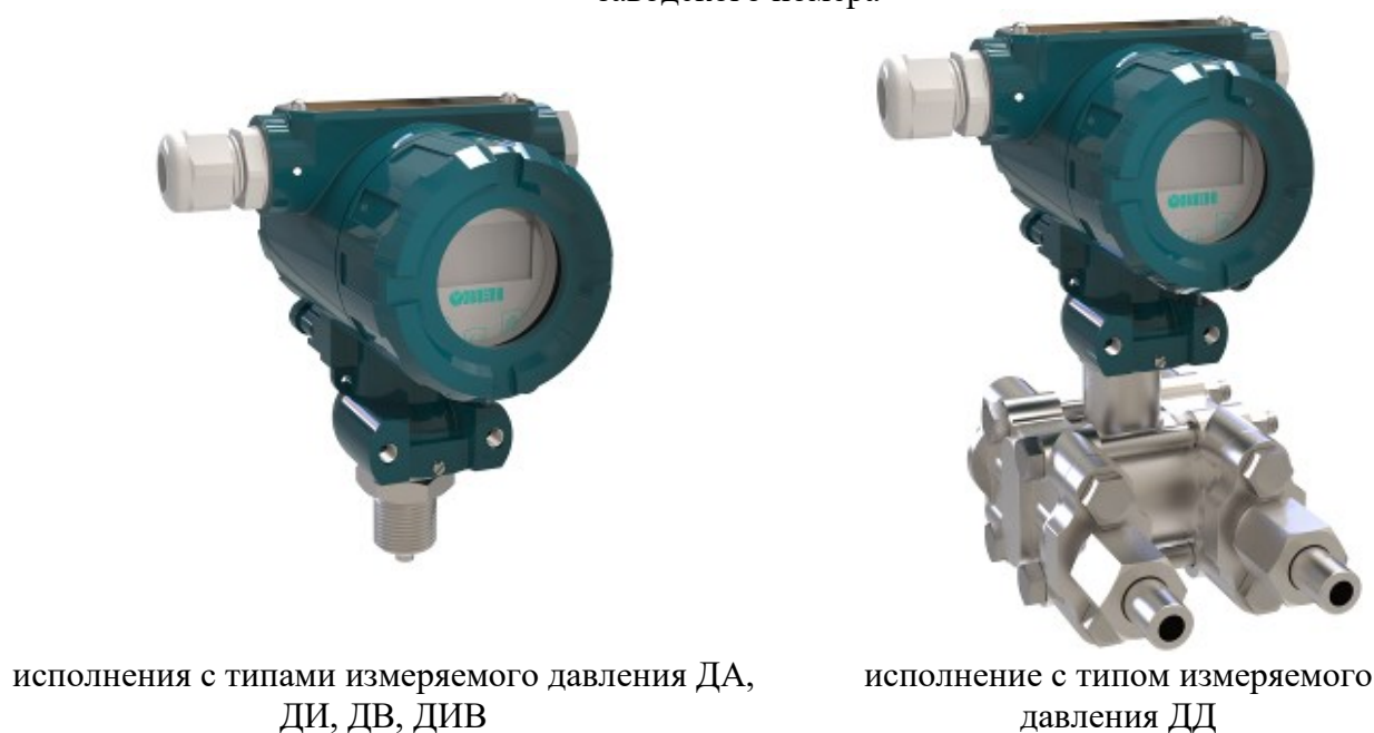
Рисунок 5 – Общий вид преобразователей давления измерительных ОВЕН ПД100И со встроенным дисплеем в общепромышленном исполнении