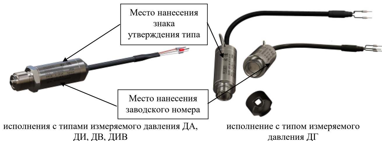
Рисунок 4 – Общий вид преобразователей давления измерительных ОВЕН ПД100И со встроенным кабелем с указанием места нанесения знака утверждения типа, места нанесения заводского номера