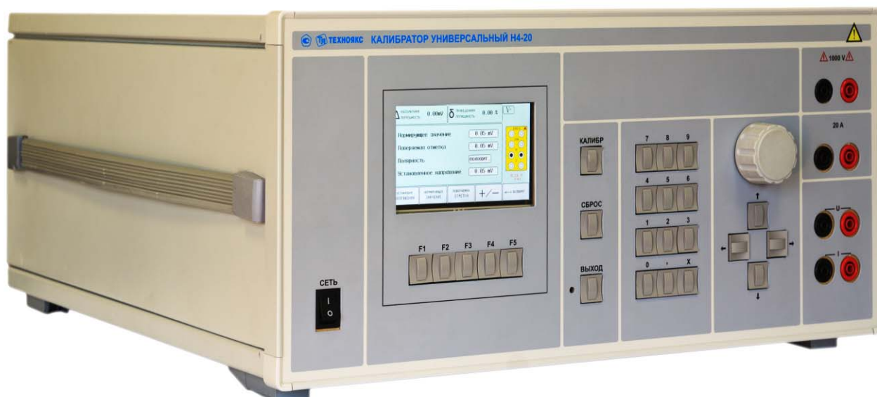
Рисунок 1 - Общий вид прибора

Общий вид прибора представлен на рисунке 1.