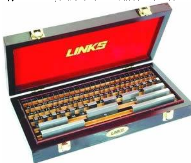
Рисунок 1 – Общий вид набора мер длины концевых плоскопараллельных серии 901

Концевые меры длины выпускаются 5-ти классов точности: К, 0, 1, 2 и 3.